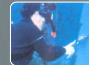
PERMASTAR Specially protective coating for application coatings