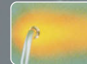
CERABEST Ultra heat resistant paint

Được chuyển giao công nghệ của hãng Chugoku Marine Paints (CMP Nhật Bản), một trong 6 hãng sơn hàng đầu thế giới trong lĩnh vực tàu biển, công trình biển với kinh nghiệm sản xuất sơn gần một thế kỷ phục vụ cho ngành công nghiệp đóng mới và sửa chữa tàu biển tại Nhật bản và trên toàn thế giới.