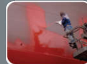
UNY High build Polyurethane for finish coating