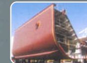
BANNOH Universal primer over which any type of paint can be applied