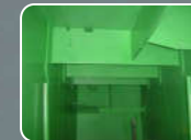
HIPOXY PRIMER CLF High solid and heavy metal free primer coatings